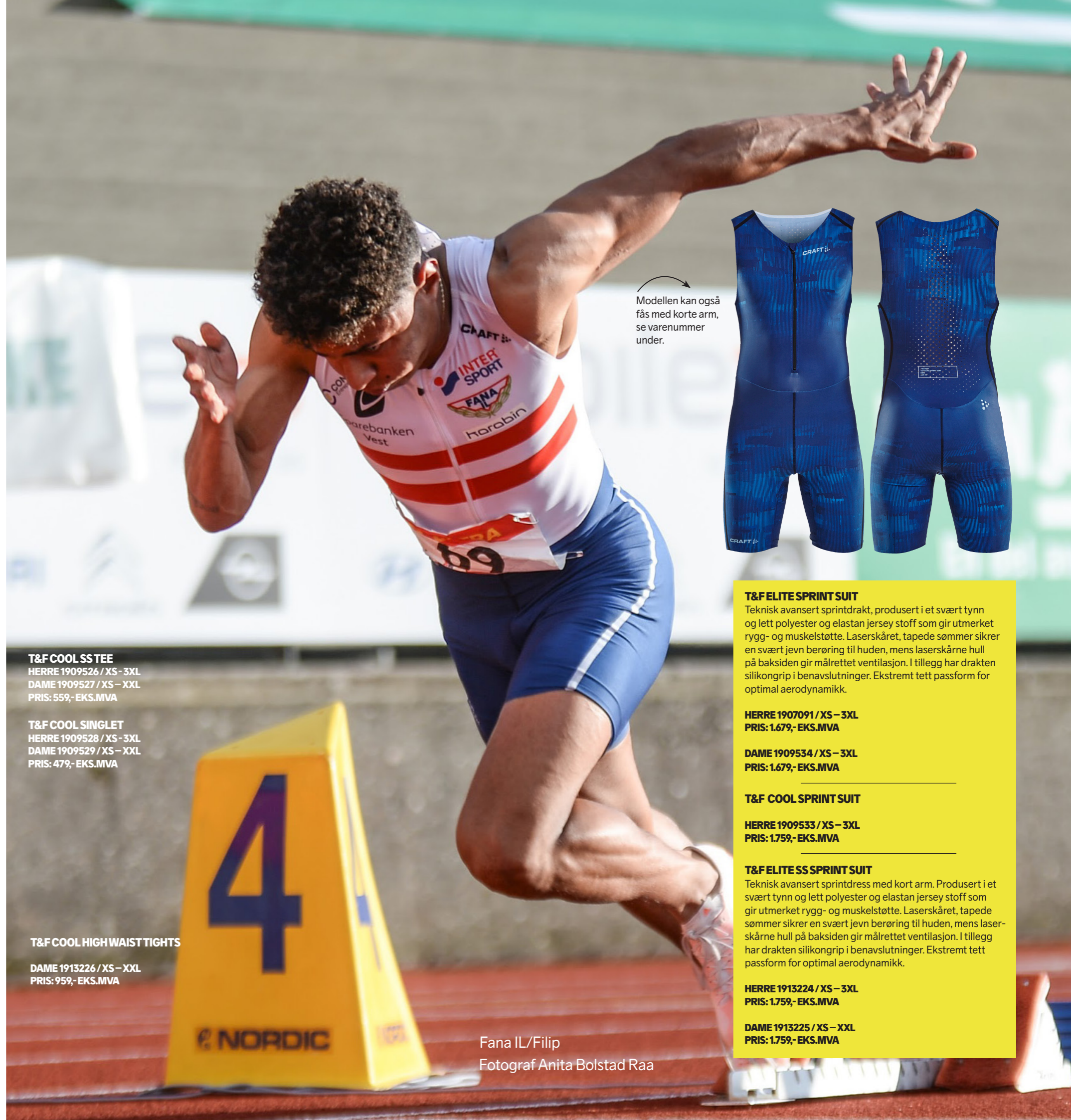
Fana IL/Filip

DAME 1913225 / XS – XXL PRIS: 1.759,- EKS.MVA