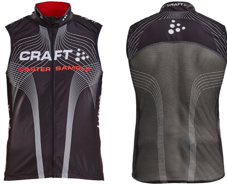
PERFORMANCE BC WIND VEST 2.0 Vindtett front. Netting i ryggpanel.

HERRE 1908148 / XS-5XL DAME 1908149 / XS-3XL PRIS: 879,- EKS.MVA