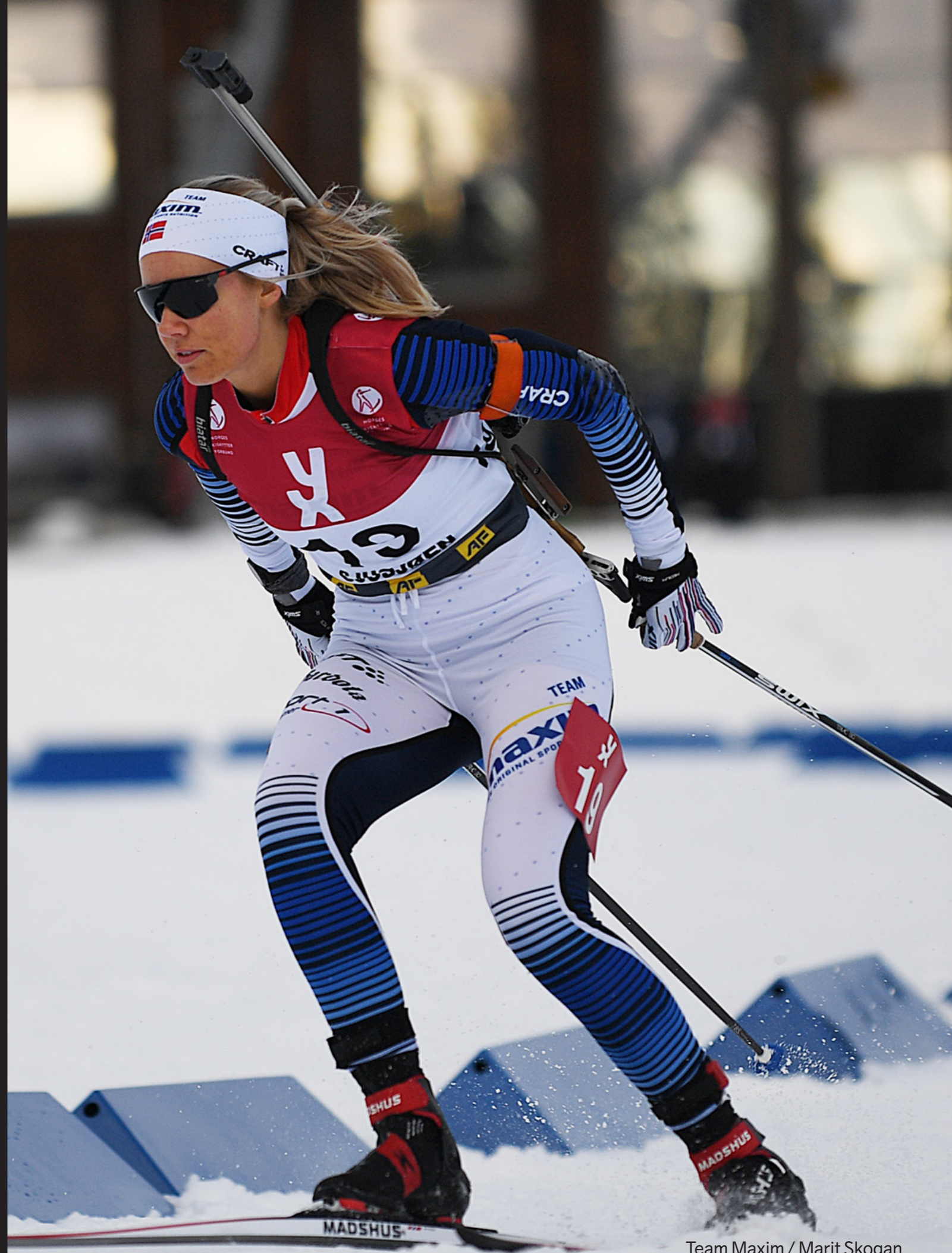
Team Maxim / Marit Skogan