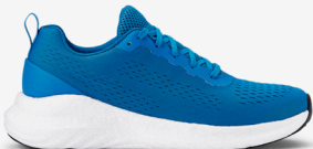
632 OCEAN BLUE