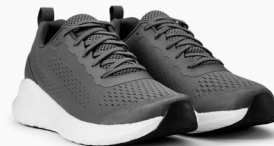
935 STEEL GREY