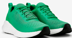
728 FRESH GREEN