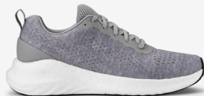
120 GREY MELANGE