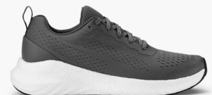
935 STEEL GREY