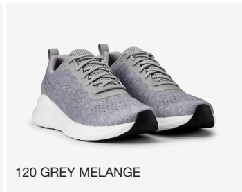
120 GREY MELANGE