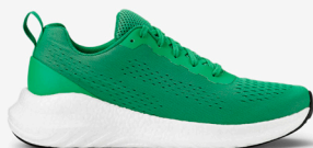
728 FRESH GREEN