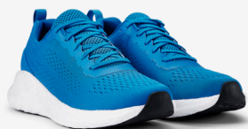
632 OCEAN BLUE

Våre stilige sneakers tilbys i de åtte synkroniserte Printer Essentials fargene, og finnes i en bred utvalg av størrelser – fra str. 35 til str. 47.